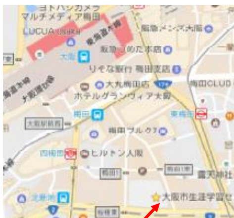
大阪市総合生涯学習センター